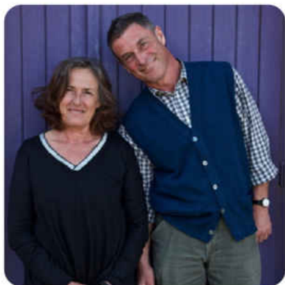
Pouilly-Fuissé Les Birbettes 2020 Château des Rontets