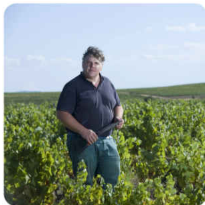
Moulin à Vent Champ de Cour 2020 Domaine des Pierres Roses