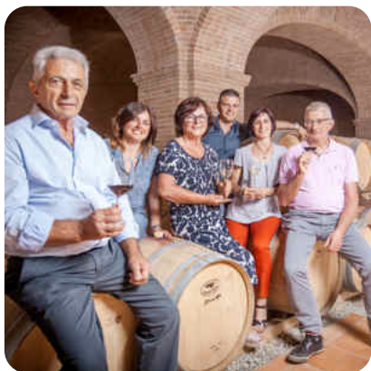
Barbera d'Asti Frem 2020 Scagliola Sansi