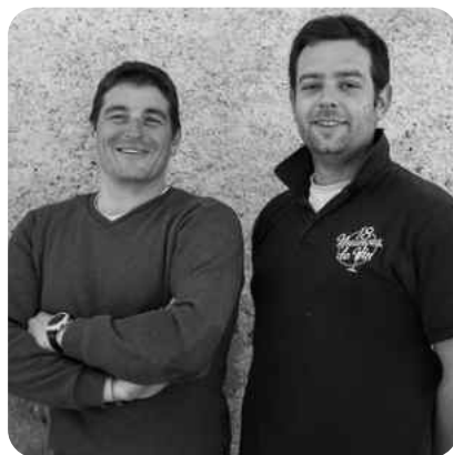
Touraine Amboise Les Beauvoirs Version Longue 2019 Domaine Bonnigal-Bodet