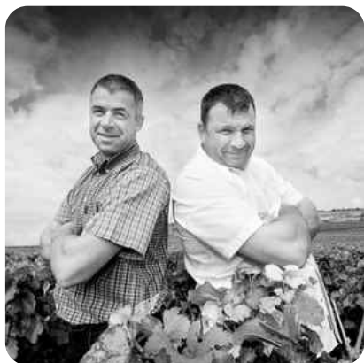
Nuits-Saint-Georges 1er Cru Les Chaignots 2019 Domaine Robert Chevillon