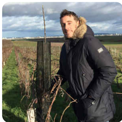
Champagne Brut Nature Mouvance 17 NM Champagne A.Lamblot