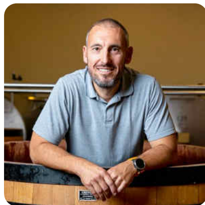
Beaune blanc 1er Cru Grèves Le Clos 2019 Maison Louis Jadot