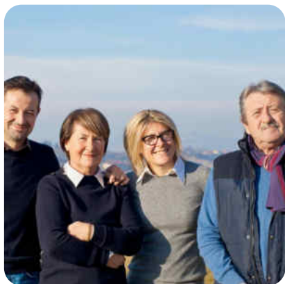
Barbaresco Pajoré 2019 Azienda Agricola Sottimano